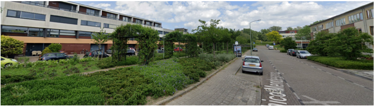
Figuur 3: In de buurt Azobe in Dordrecht is veel openbaar groen: per woonadres 252 m 2.