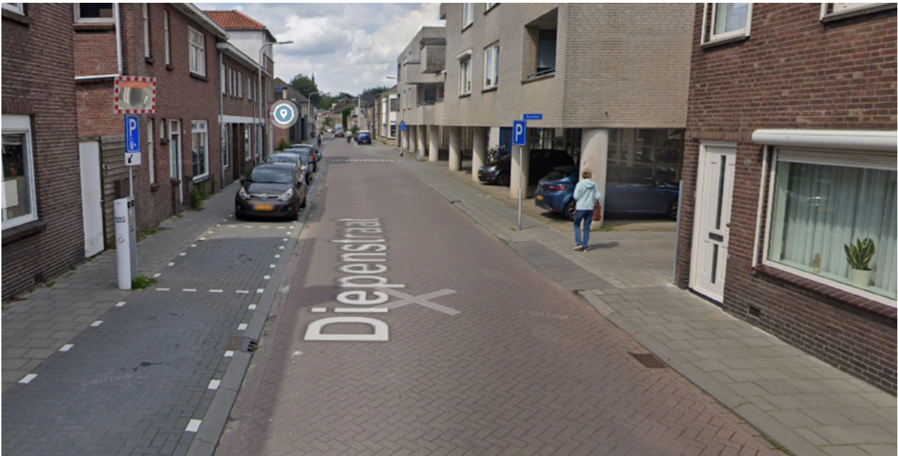
Figuur 2: Een straat zonder openbaar groen in de meest versteende buurt van Tilburg: de Schildersbuurt (Google Streetview).