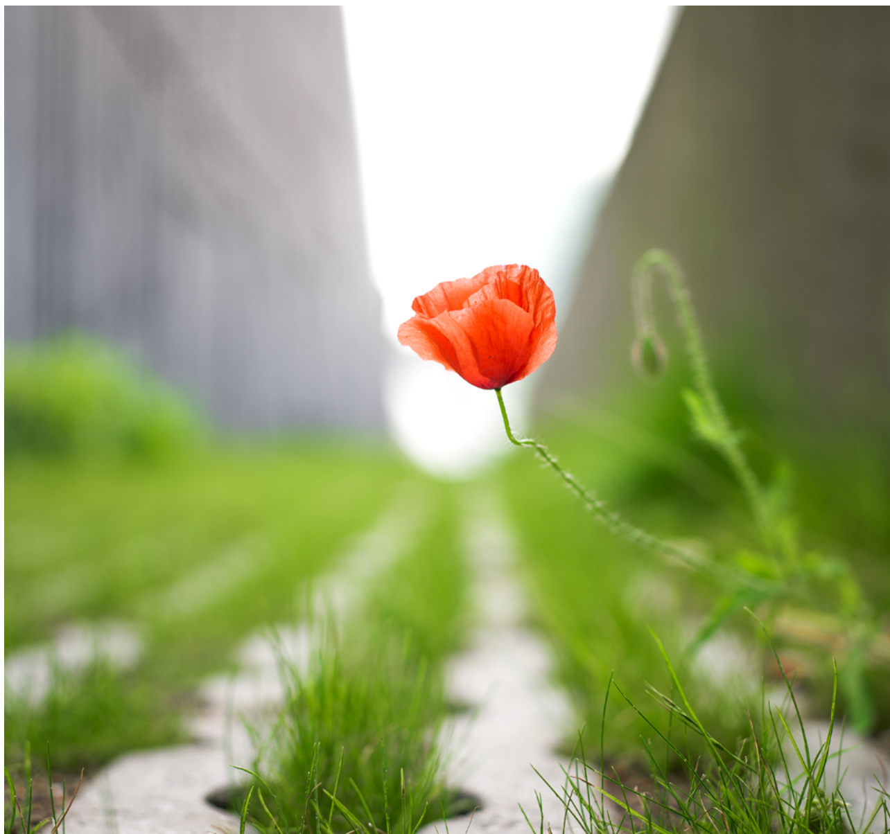
Tabel 12: Totaalbeeld boomkroonbedekking in G32-gemeenten in 2023.