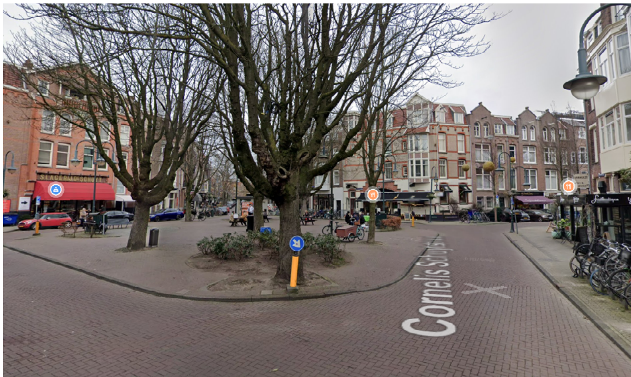
Figuur 4: De Cornelis Schuytbuurt (Amsterdam) is met 0,5 m 2 groen per woonadres een zeer versteende buurt, waarbij boomkroonbedekking echter niet is meegenomen

te zien. Dit is een van de meest versteende buurten van Nederland, met in 2024 een halve vierkante meter openbaar groen per woonadres. Boomkroonbedekking in vierkante meters is hierin niet meegenomen, maar zoals te zien op de afbeelding zijn er wel bomen aanwezig. Bomen leveren een positieve bijdrage aan de leefbaarheid van de stad, bijvoorbeeld door het verbeteren van de luchtkwaliteit. Ze bieden verkoeling en ook schuilplekken voor vogels en insecten.