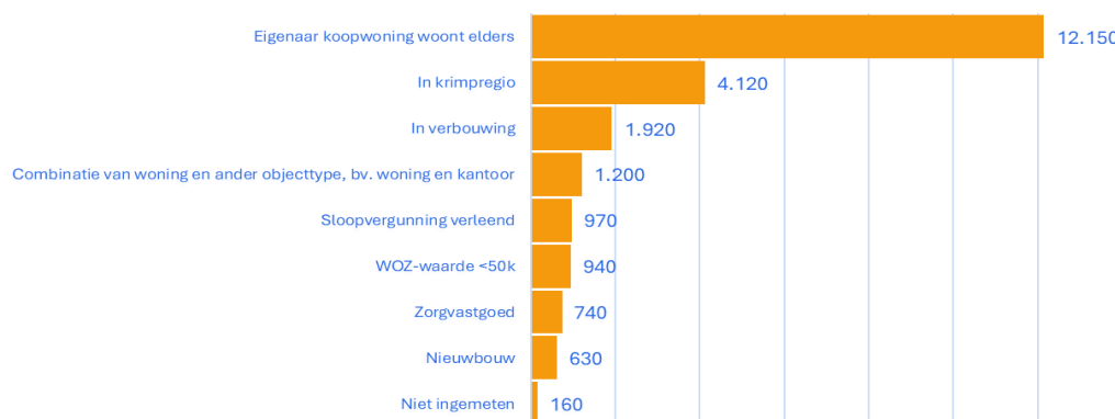
Figuur 3. Mogelijke verklaringen structurele leegstand na energiecorrectie, in aantallen woningen die aan één of meer verklarende kenmerken voldoen (bron: Leegstandmonitor 2024, CBS, 29 november 2024; bewerking RIGO)

Hiermee geef ik invulling aan de toezegging aan mevrouw Beckerman over een onderzoek naar verklarende kenmerken bij structureel leegstaande woningen voor