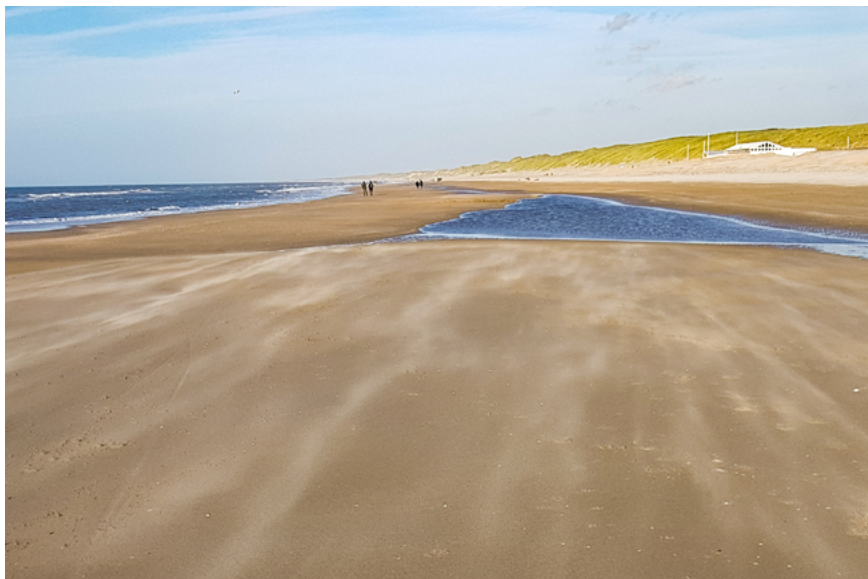
Natuurlijke duinaangroei Noord-Hollandse kust