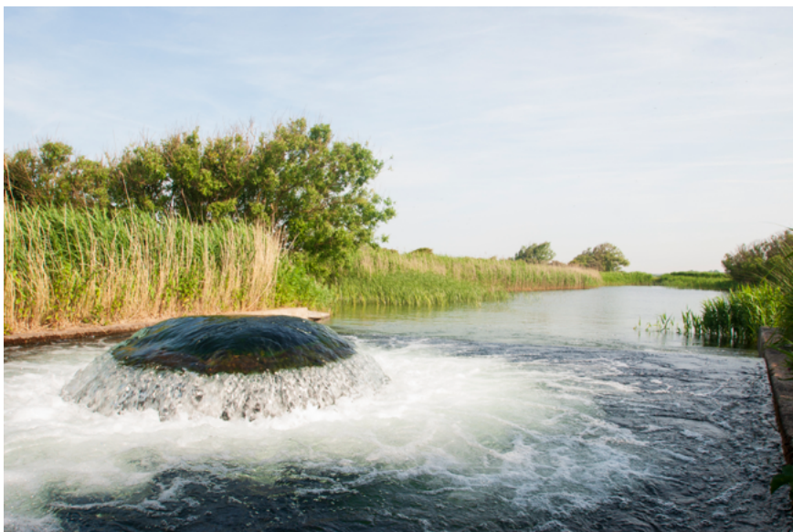
Infiltratie van oppervlaktewater in het Noord-Hollands Duinreservaat

In Noord-Holland wordt drinkwater geleverd door drie bedrijven. Waternet levert water aan Amsterdam en enkele plaatsen in de omgeving, Vitens levert water in een deel van het Gooi, en PWN in de rest van Noord-Holland. De gebieden waar het grondwater wordt gewonnen bevinden zich in het Noordhollands Duinreservaat (51 miljoen m 3 /jaar), de Amsterdamse Waterleidingduinen (70 miljoen m 3 /jaar) en het Gooi (9 miljoen m 3 /jaar, verdeeld over de winplaatsen Huizen, Laarderhoogt, Laren en Loosdrecht). Van het onttrokken water in de duinen is bijna 90% geïnfilterd oppervlaktewater. Dit water is voorgezuiverd en de kwaliteit van het water moet aan het Infiltratiebesluit/BKL voldoen. De infiltratiesystemen zijn, als beschreven in de paragraaf waterbalans, in de vorige eeuw al ontstaan toen bleek dat de grondwateraanvulling door neerslagoverschotten in de duinen onvoldoende was.