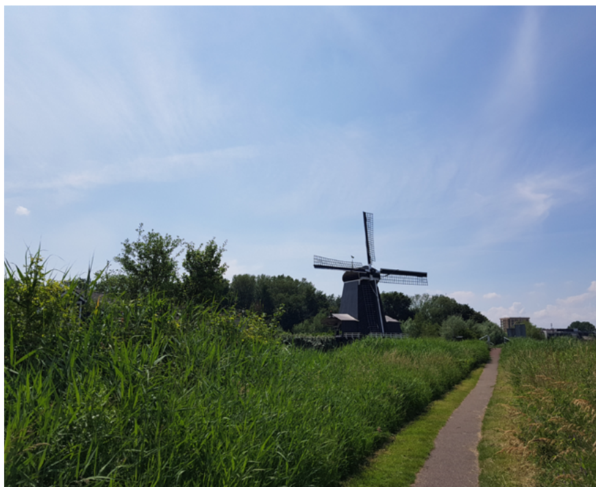
Regionale waterkering met wandelpad langs rivier het Spaarne

De waterkeringbeheerders voeren in afstemming met de provincie verkenningen uit ten aanzien van het wel of niet compartimenteren van gebieden door het aanwijzen van compartimenteringskeringen. Hierbij wordt de compartimenterende werking van wegen, spoorlijnen, en dergelijke onderzocht. Hiermee wordt beoogd dat schade en slachtoffers worden gereduceerd bij een doorbraak van een primaire waterkering. De kaart met de regionale waterkeringen is te raadplegen in de provinciale viewer .