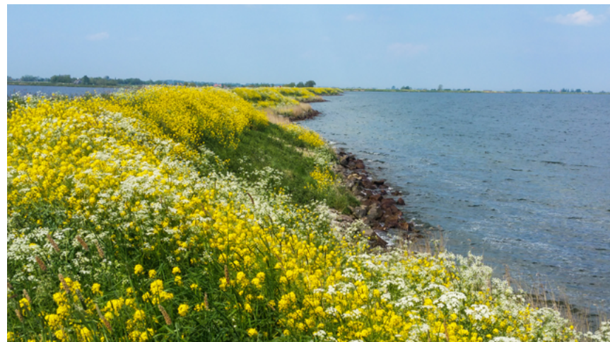
Dijkversterking Waterlandse zeedijk, Markermeerdijk

Ruimtelijke kwaliteit is de landschappelijke waarde en de gebruiks- en toekomstwaarde van een dijk en de zones die eraan grenzen. Wanneer een dijk wordt versterkt is deze weer veilig voor 50 jaar maar ook weer bruikbaar voor medegebruik voor dezelfde periode. Dit medegebruik en het toevoegen van extra ruimtelijke kwaliteit zal