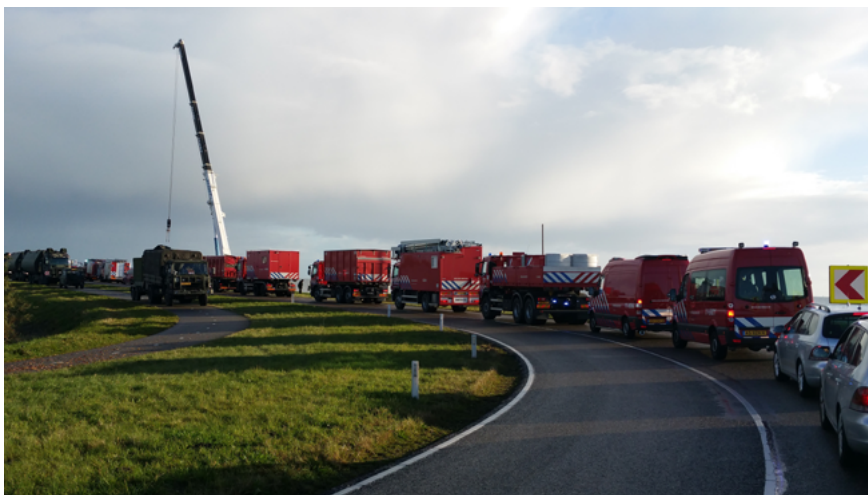
Watercrisisoefening Waterwolf op Marken