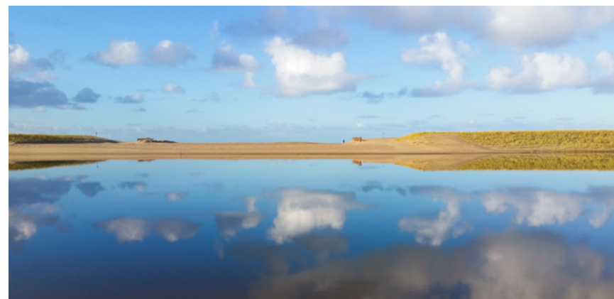
Zeewaartse versterking van de kust bij Camperduin

Noord-Holland is omgeven door water en ligt voor een groot deel onder N.A.P. Bescherming tegen overstromingen is dan ook van groot belang. In haar Omgevingsvisie NH2050 heeft de provincie opgenomen dat de bescherming die de